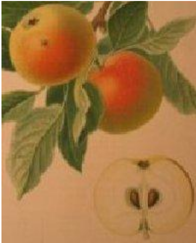
Deutsche Kernobstsorten, 1900, von Goeth.

Apples, 1993, p.204- Edelborsdorfer). Décrite par W.Lauche, "Deutsche Pomologie", 1882/83, n° 60.